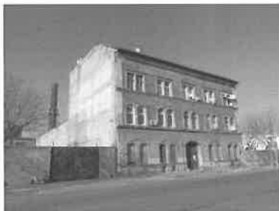
05. értékelt ingatlan, szomszédos terület