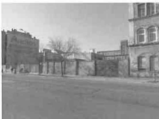
03. szomszédos telek