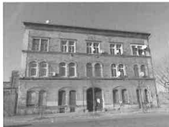
06. értékelt ingatlan