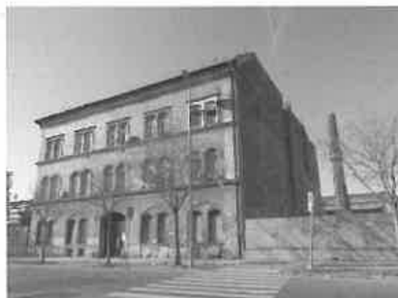
04. értékelt ingatlan, szomszédos terület