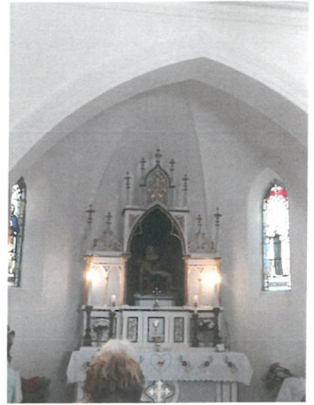
Magyarpolány-Herend 2022. március 26.