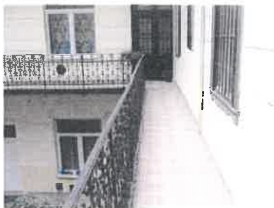
belső homlokzat, közlekedő folyosó