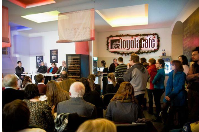
A hasonlóan működő példakép: a Loyola Café a Párbeszéd házában 1.

A pincetér belmagasságát mintegy 50cm-rel növeljük, így egy jó arányú térsort hozunk létre. A három traktusos térrész első, utca felőli terébe érkezik a látogató, amely teljes egészében vendégtér. Több, mint 50 m 2 -es alapterülete lehetővé teszi itt kisebb kamarakonzertek, felolvasóestek megtartását is.