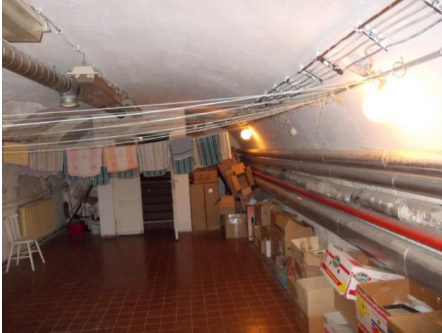
Szárítóhelyiség a pincetérben

A pincében jelenleg mosókonyha és szárító és egy raktárhelyiség található. A falak csak helyenként nedvesek, ez azonban egyértelműen a szárítási és mosási tevékenységnek az eredménye, a talaj felől vizesedés nem tapasztalható, összességében tehát jó állapotú és jó adottságú területről beszélünk.