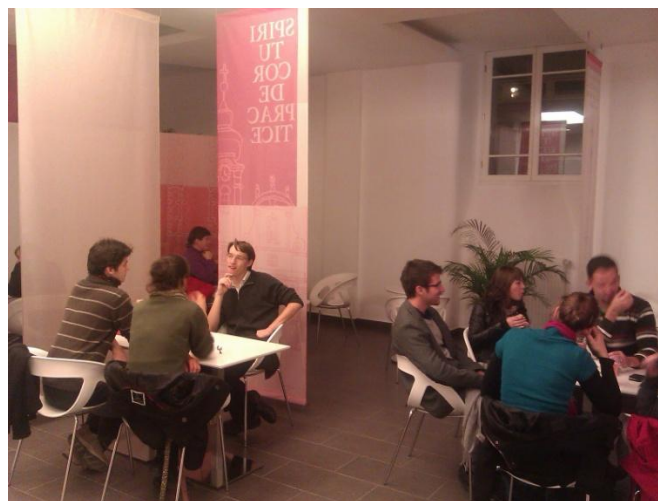
A hasonlóan működő példakép: a Loyola Café a Párbeszéd házában 1.

A térhez belsőépítészeti finoman nyúlunk. Kiemeljük a régi téglafalak és boltozatok struktúráját, a gépészeti vezetékeket elfedjük, részben pedig más felé vezetjük. A textúra kiemelését segíti a közvetett világítás. Modern, visszafogott bútorokat helyezünk el a térben, "halk" színeket alkalmazunk.