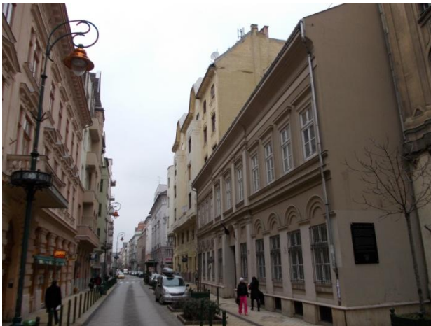
Az épület a Ráday utca felől

A Boldogasszony Iskolanővérek valamint a fenntartásában működő Patrona Hungariae Katolikus Iskolaközpont bejárata a Knézich utcai fronton van. Jelenleg csupán az ugyancsak a Boldogasszony Iskolanővérek fenntartásában működő Nikodémus Szeretetotthon gazdasági bejárata található a Ráday utcai részen. A tervezett beruházással az egy helyrajzi számhoz tartozó épületkomplexum a Ráday utca felől is nyitottabbá válna.