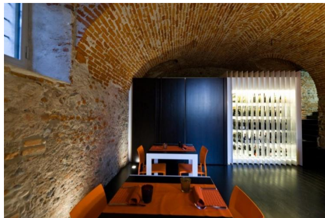
A falakat megtisztítjuk a teret visszafogott modern elemekkel egészítjük ki.

A feljebb említett kapualjban található kőkeretes nyíláson át egy lépcsőn juthatunk majd le a kapualj felől a pincetérbe. A kapualj utolsó 2m-es szakaszát egy félig áttetsző, ólomüvegre emlékeztető nyílászáróval választjuk le a közönség által használható kapualjtól. Az üveg erősen hangszigetelő lesz, hogy az utcai zajt ne engedje a kerengő területére. Sejtelmes áttetszősége finoman mutat meg valamit a belső, nyugodt világból.