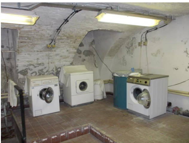
Mosókonyha a pincetérben

A klasszicista épület szimmetrikus kialakítású. Középtengelyében található a kapu, melyen belépve egy boltozatos átjárón keresztül juthatunk a szeretetotthon belső kertjébe. Az épület felerészben alapincézett. Az utca felől nézve jobb oldali épületrészben a kapualj és a tűzfal közötti szakasz között található egy boltozatos pincerész. Falai téglából épültek, alapozása a feltárások szerint vegyesen mészkő és téglá, az 1,70 cm mély feltárásokkal sem értük el az alapozás alsó síkját.