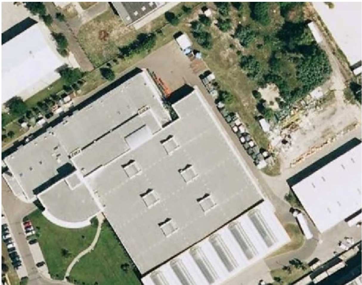
Részlet a tervezett M-IX-2 építési övezetben működő lapkiadó telephelyéről.

Az áruk tárolására, többnyire a telek nem beépített, burkolt, szabad területeit is igénybe veszik, ami sem a tárolás szempontjából (vagyonbiztonság, időjárási hatások), sem városképi szempontból nem lehet előnyös.