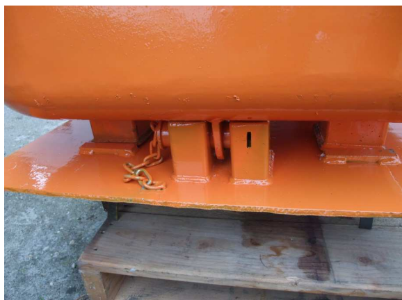
3. ábra Billentő fül a rögzítő csappal