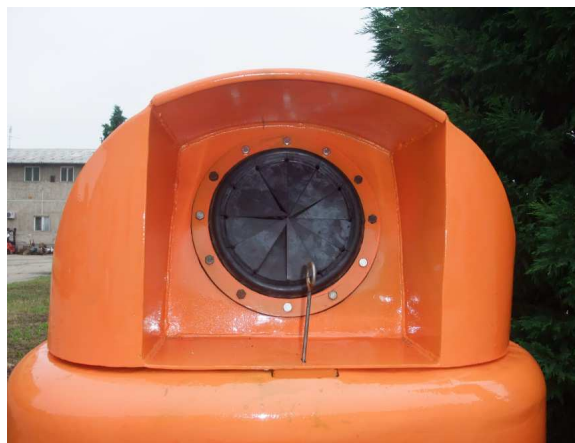
2. ábra Fedél a bedobó nyílással