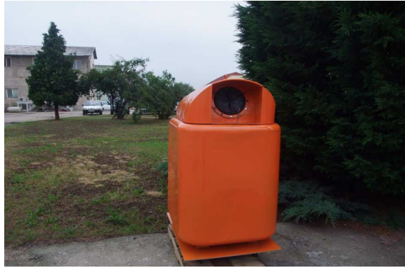
1. ábra Az OGY-I. jelű konténer