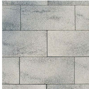
Semmelrock Umbriano, gránitszürke színben