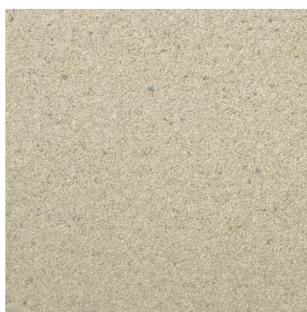
Semmelrock Senso Grande térkő burkolat, homokbarna