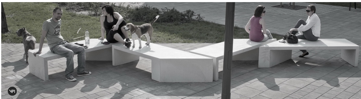
előkép: VPI padok/ Zigza betonpad