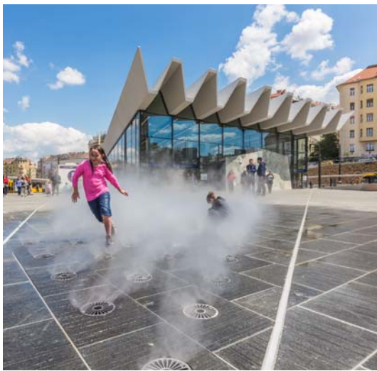
előkép: párasító berendezés

A déli, Tűzoltó u. felőli belső udvar tervezett kialakítása magába foglal egy párasító vízarchitektúrát az étterem terasza környékén. A közlekedési útvonal mentén ülőkavicsok és VPI padok/ Zigza betonpadok elhelyezése javasolt. A két udvar közti fedett átjárónál, az étterem épülete által határolt sarokban képzőművészeti alkotás elhelyezése javasolt.