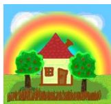
Varázskert IX/1. sz. Bölcsőde 1096 Bp. Thaly Kálmán u.17.

A részleg arculata: A bölcsőde és a család kapcsolatának folyamatos fejlesztése és megerősítése. A szülőkkel való folyamatos együttműködés a jó színvonalú ellátás alapvető feltétele, mellyel kölcsönösen befolyásolják az intézmény tevékenységének és a gyermekek nevelésének folyamatát. A szülők és a nevelők közös felelőssége a gyermek fejlődéséhez szükséges optimális feltételek biztosítása. A részleg a kapcsolatot közös programokkal erősíti, mely részletes kifejtése és a megvalósítás folyamatát a bölcsőde szakmai programja biztosítja.