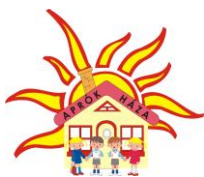
Aprók háza IX/4. sz. Bölcsőde 1092 Budapest, Ráday u. 46.