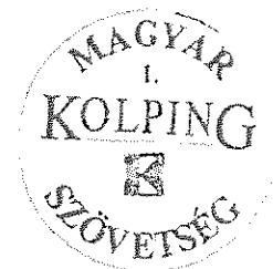
Kövesi Ferenc Elnök-Prézes