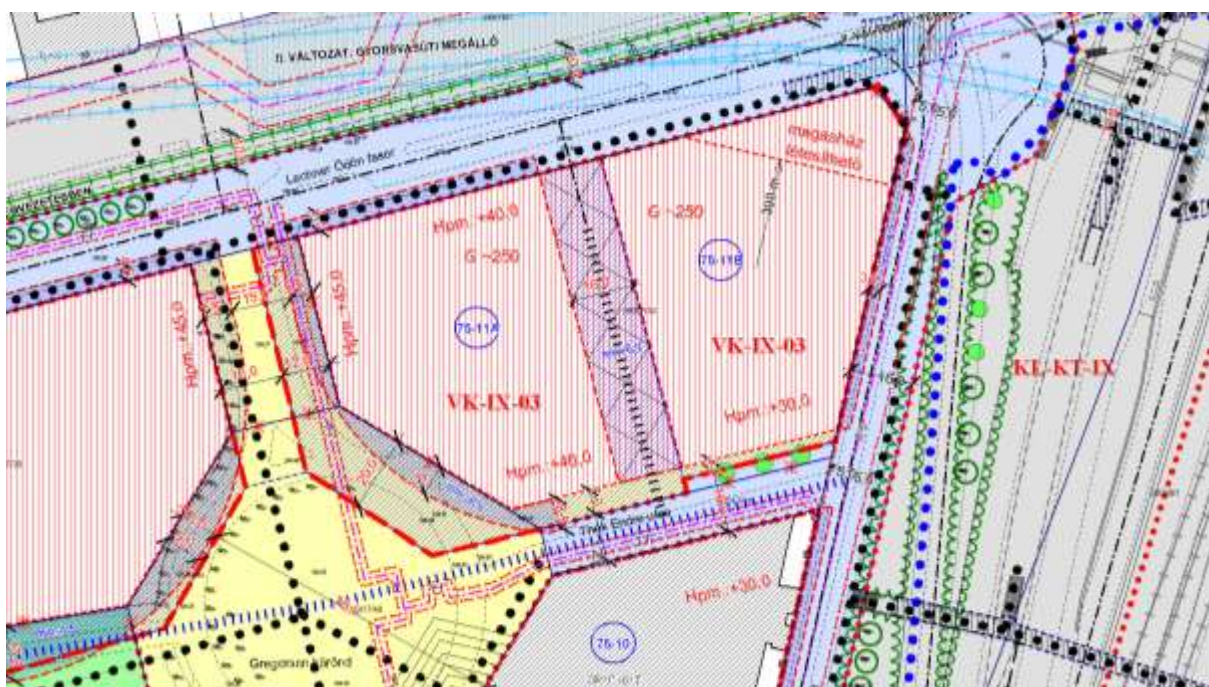
A Budapest Főváros IX. kerület Ferencváros Önkormányzata 9/2006.(III.10.) KT rendeletével jóváhagyott KSZT kivonata

A területre vonatkozó KSZT módosítás „az új budapesti konferencia-központ létesítésének előkészítésével kapcsolatos intézkedések megtételéről, valamint a szükséges források biztosításáról szóló 1871/2013.(XI.22.) Korm. határozathoz” kapcsolódó beruházás.