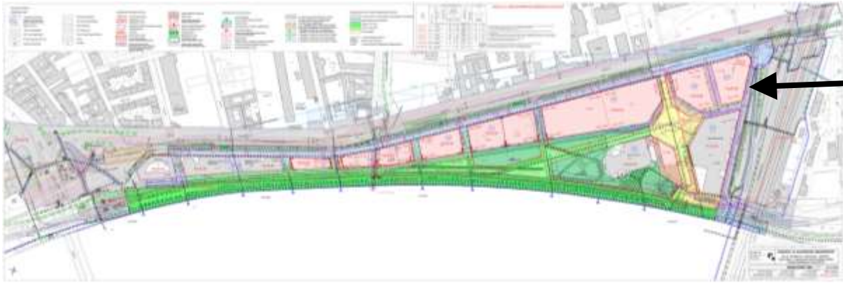
A Budapest Főváros IX. kerület Ferencváros Önkormányzata 9/2006.(III.10.) KT rendeletével jóváhagyott KSZT kivonata