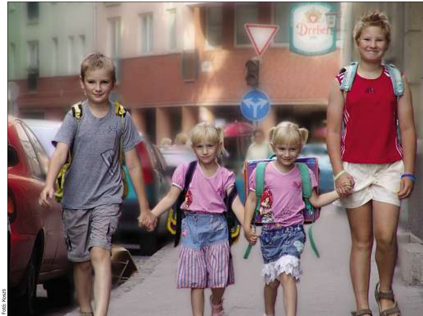
Szeptember elsejétől utcahosszban és „utcaszéltében” is találkozhatunk reggelként az iskolába igyekvő diákokkal

Pénteken egy gyenge hidegfront vonul át felettünk, hatására átmenetileg erősen megnövekszik a felhőzet és elszórtan zápor, zivatar is előfordul. Az északnyugati szél megerősödik, zivatarok környezetében viharossá fokozódik. Szombaton eleinte még megélénkül a szél, majd mérséklődik a légmozgás, a kezdetben felhős ég után derült idő következhet. Friss, tiszta idő valószínű. Vasárnap is derült, száraz idő várható, emelkedő hőmérséklettel.