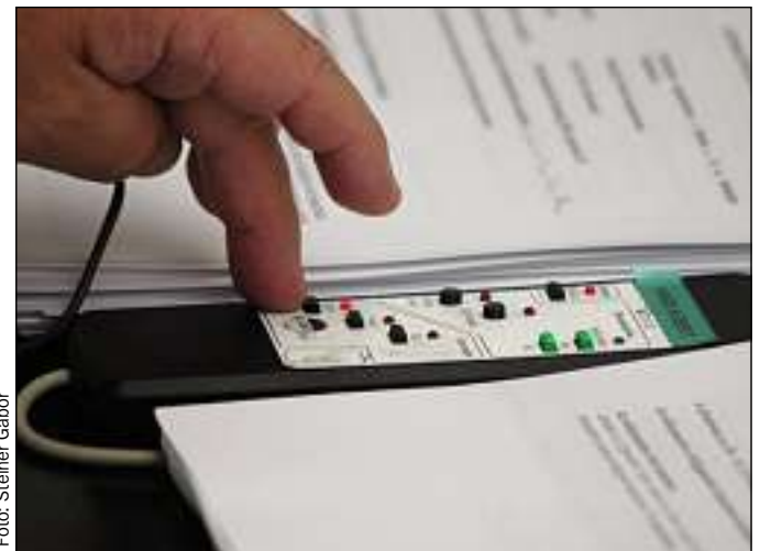
A nyári szünet után újra asztalra kerültek a szavazóképek

Egyebek mellett első fordulóban tárgyalták és egyhangúan elfogadták a Soroksári Duna-ág menti terület szabályozási tervét. A dokumentum illeszkedik a szomszédos Pesterzsébet mienkéhez csatlakozó partszakaszára kidolgozott szabályozási tervhez és Budapest legimpozánsabb Duna-parti ingatlanfejlesztésének jogszabályi kereteit rajzolja körül.