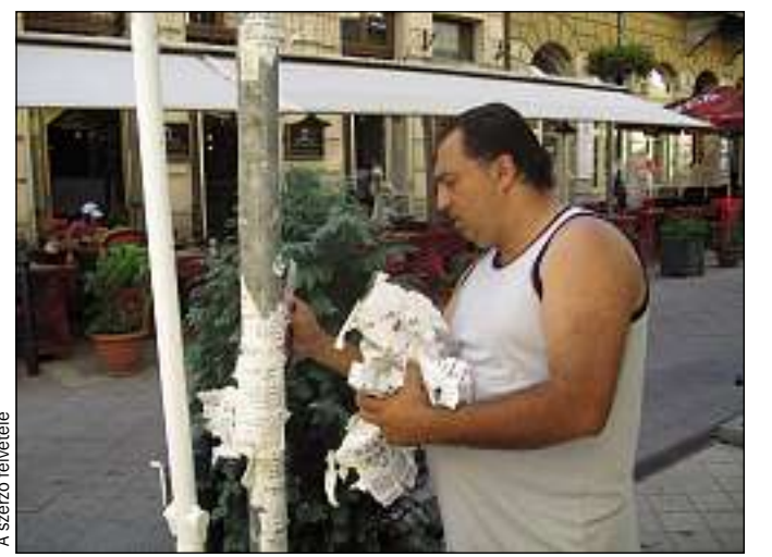
A fővárosi utcán a City Guardian Bt. felületet küzdelmet a vadplakátok ellen