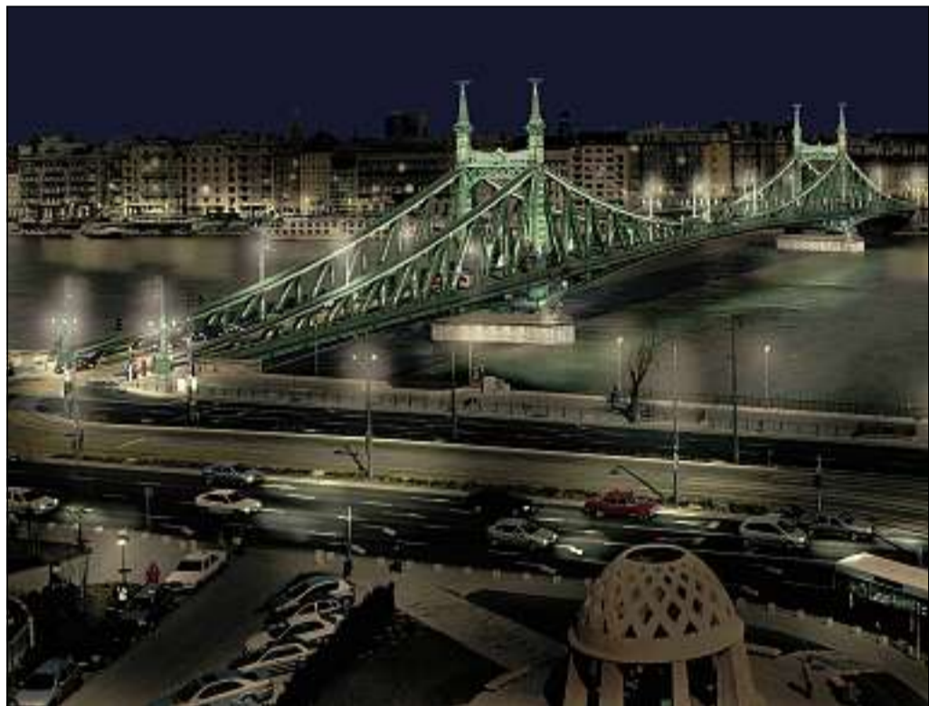
A Szabadság híd díszvilágítási látványterve – Lisy Zrt.

A világörökségi területhez méltó fényköntöst kap