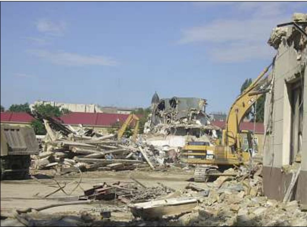
A malom gabonaellátása a rendszerváltás körül, amikor a Duna-parti teherpályaudvart is felszámolták, ellehetetlenült

nál lehetett megoldani a zavarmentes szállítást, ez ezért maradt meg hírvondónak a Soroksári úton. Jelentősége viszont ezzel csak nőtt a főváros életében.