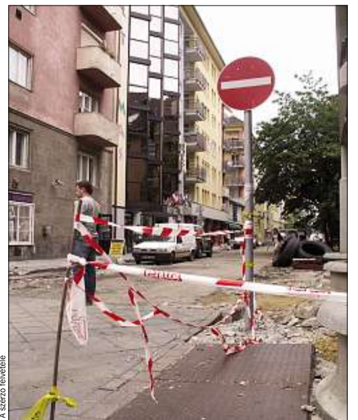
A Tompa utcától az Üllői útig diszburkolat fedi szeptembertől a Liliom utcát is