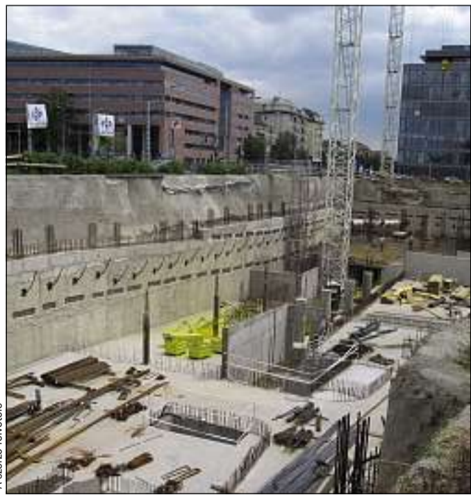
Valószínűleg irodaházként értékesítik az egész Haller Kaput

látható, hogy egy CEU Közpolitikai Iskola is létesülhet. Logikus viszont, hogy költözés esetén a CEU Business School és a CEU Közpolitikai Iskola egy épületben kapjon majd helyet – tájékoztatta lapunkat a CEU külkapcsolatokkal foglalkozó irodája.