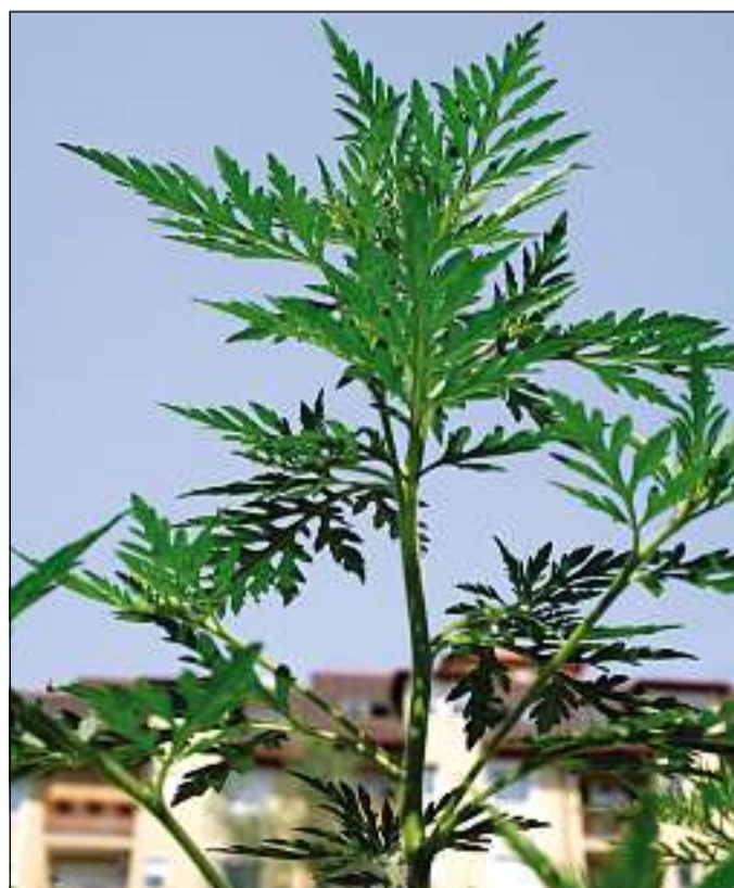
A parlagfű könnyen felismerhető jellegzetes leveleiről

Az allergia tulajdonképpen a szervezet túlzó védekezése az idegen fehérjékkel szemben. Je-