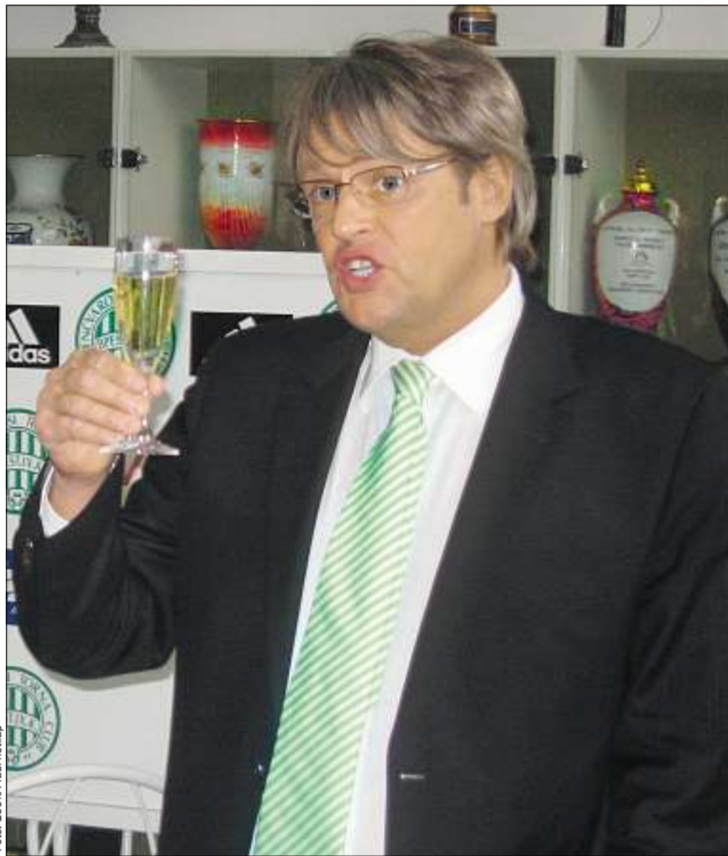
Megnyugodva ürítheti poharát a Fradi jövőjére

– Bár nem beszéltem róla, de valóban gyerekkorom óta fradista vagyok – 1961-ben kezdtem úszni az egyesületben – kezdte a beszélgetést. – Boldogan mutogattam az első igazolványomat, s hihetetlenül