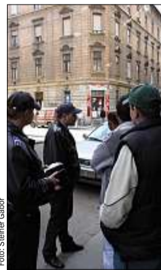
Nagyobb rendőri jelenlétre számíthatunk

Már látszik az eredmény is, jelentősen csökkent a vagyoni elleni bűncselekmények száma. Az aluljárókat is rendszeresen ellenőrzik a koldusok, különös tekintettel az erőszakos kéregetők miatt. Akad közöttük néhány, aki késsel igyekszik nyomtatékok