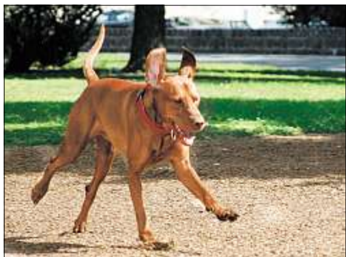
Talán most elsimulnak az ellentétek kutyasétáltatók és parkhasználók között