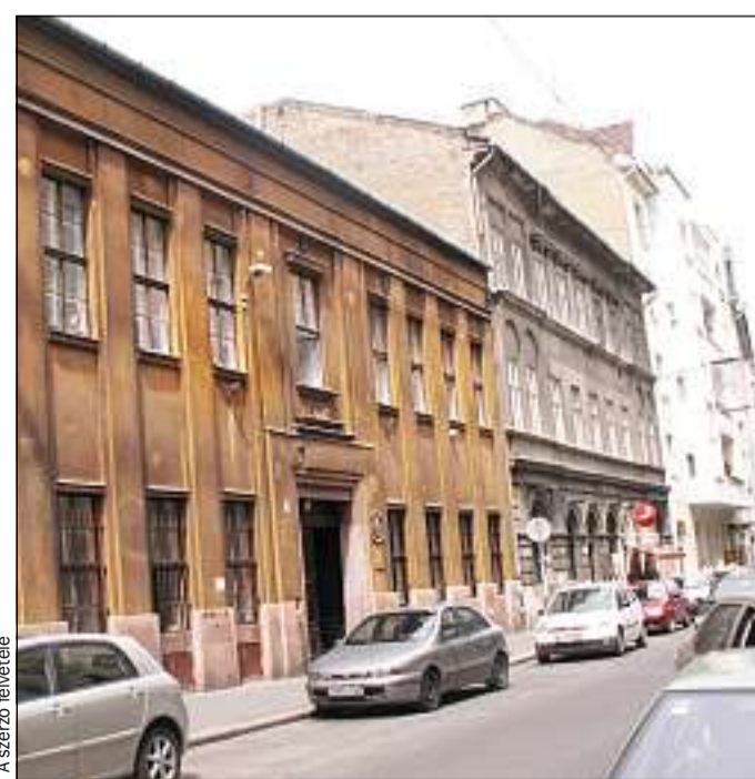
Megnyílt az út, hogy a Ráday utcai korszerűtlen épület sorsa rendeződjön

működik a Beruházási és Városüzemeltetési Irodája és a Közbeszerzési Csoport. A cég, amely megvásárolta, mivel szállodát szeretne létrehozni az ódon épületből, megkereste az önkormányzatot egyeztetés céljából, hiszen birtokba venné jogos tulajdonát. Mi nem kívánjuk ezt a beruházást